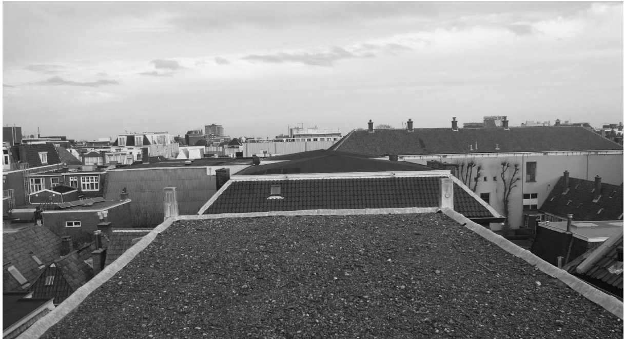
Het dak van de Lutherse kerk, richting Haddingestraat (foto november 2009).

Op de hoeken van het kerkdak zien we twee zware voetstukken. Het zijn geen schoorstenen, want die hebben daar nooit gezeten. Het moeten de voetstukken van de bouwornamenten zijn die nu onder de kap staan. Aan de bovenkant van de tekening mist kennelijk een reep papier, waardoor de pijnappels zelf zijn weggevallen. Tegenwoordig bevinden zich op de hoeken van het kerkdak smalle, door daklood afgedekte rechtopstaande balkjes. Deze zijn van recente datum en herinneren slechts door hun vorm aan de voetstukken die hier ooit eens hebben gestaan. Verder is het interessant op te merken, dat volgens de tekening het dak van het voorhuis oorspronkelijk ook werd gemarkeerd door ornamenten, in dit geval bollen. Deze zullen in de loop van de negentiende eeuw, vermoedelijk tijdens de herbouw van het voorhuis, verloren zijn gegaan.