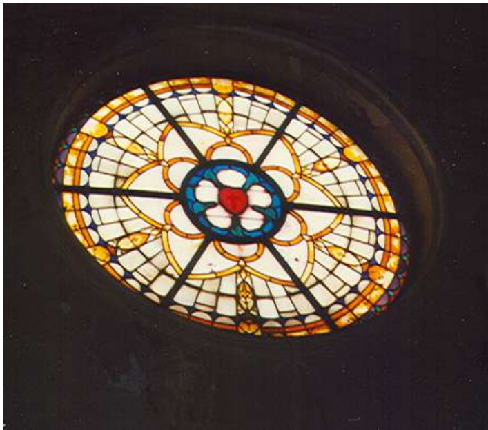
afbeelding 5: het oude raam

worden. De exploitatiestichting gaf Broekhuizen toestemming om een heel nieuw raam te maken, maar dat moest wel gelijk zijn aan het oude.