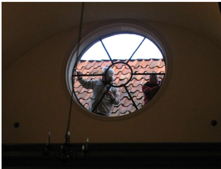
afbeelding 6: het raamwerk wordt gerestaureerd

gezet. Van het eindresultaat kunt u een afbeelding zien op de voorpagina. Zo kon het nieuwe raam tenslotte worden geplaatst op de plek van het oude en zo is een stukje van de Lutherse kerk in ere hersteld.