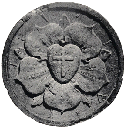
afbeelding 1: de lutherroos

De cantatedienst van 14 januari dit jaar markeerde het officiële einde van de restauratie van het ronde venster aan de oostzijde van de Lutherse kerk. Alvorens op deze restauratie in te gaan, is het nuttig eerst iets te zeggen over de afbeelding: de zogenaamde Lutherroos. Deze roos is misschien wel de bekendste Lutherse voorstelling die er bestaat. Zij was door Luther zelf bedacht