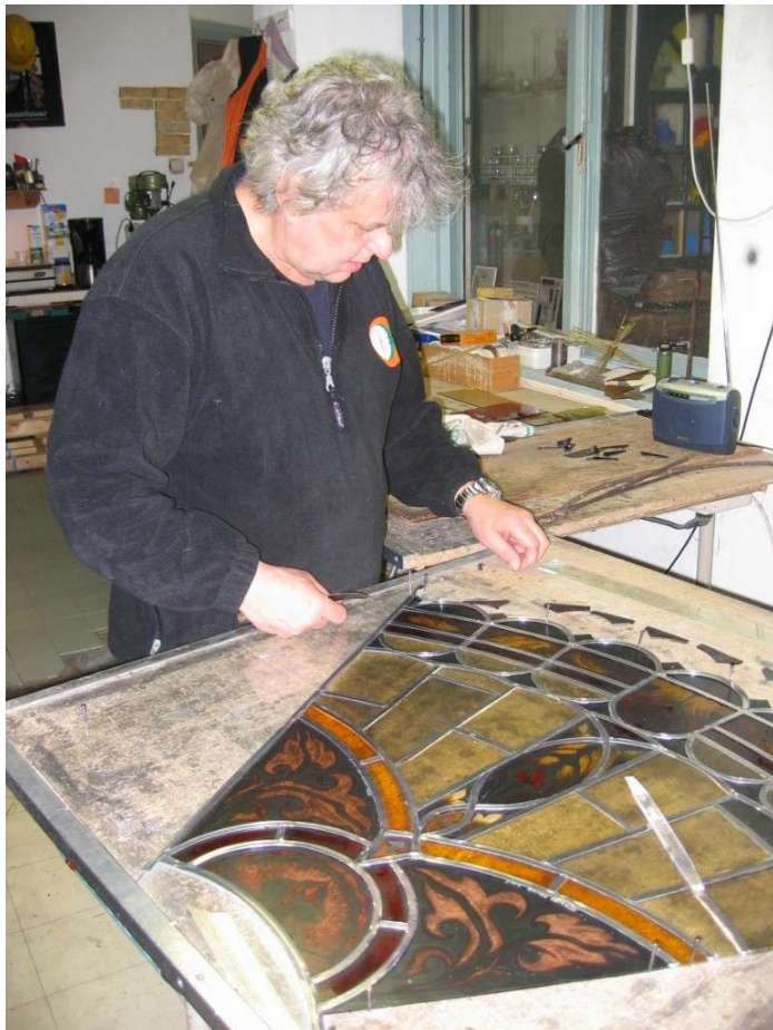
afbeelding 4: de glazenier met een van de trapeziumvormige delen van het venster